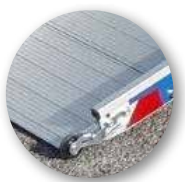
Zwei Rollen für leichtes Ein- und Ausklappen