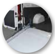
Bewegliche Übergangsklappe zur Ladefläche