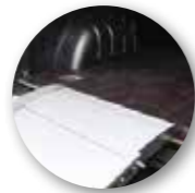
Einstellbare Halterung zum Anlegen an die Ladefläche