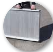
Vier Rollen und zwei Tragegriffe zum leichten Transport