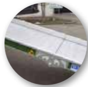
Seitliche Sturzsicherungskanten (5 cm)