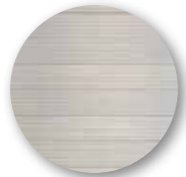
Trittfläche aus rutschfestem Aluminium