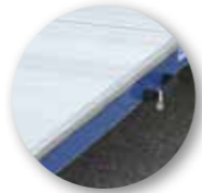
Seitliche Sturzsicherungskanten (6 cm)