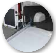
Bewegliche Übergangsklappe zur Ladefläche