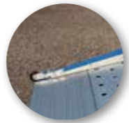
Zwei Rollen für leichtes Ein- und Ausklappen