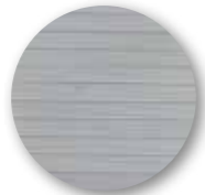
Trittfläche aus rutschfestem, eloxiertem Aluminium