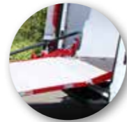
Bewegliche Übergangsklappe zur Ladefläche