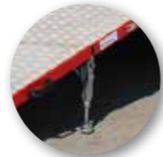
Einstellbare, selbst positionierende Füße