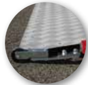
Rad für leichtes Ausklappen